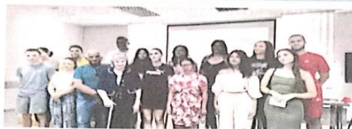
ПОКРЕНУТА ИНИЦИЈАТИВА „ШАБАЦ БЕЗ БАРИЈЕРА“