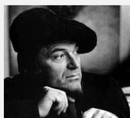
МИЛИЋ ОД МАЧВЕ