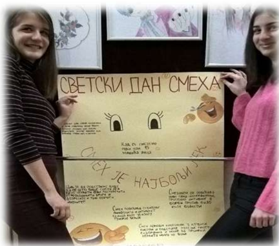
Слика 6. Мај- биохемијски лек за завршетак школске године