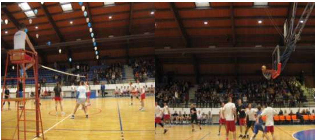
9. 12. 2017. Свечано отварање спортске сале : турнири у одбојци и кошарци

Свечано отварање спортске сале било је 9. децембра 2017. и тада су организовани међуодељенски турнири у одбојци, рукомету , кошарци и фудбалу. Чланице гимнастичке екипе школе извеле су обавезну вежбу на партеру и акробатским елементима одушевиле публику. Гост наше школе била је женска рукометна екипа гимназије из Бијељине.